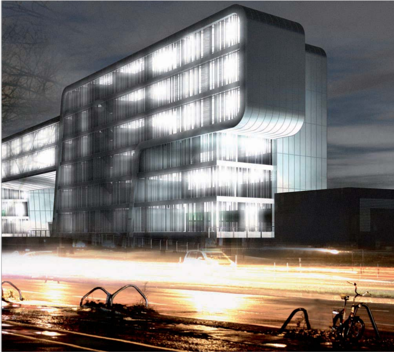
Neubau RheinauArtOffice, Rheinauhafen Köln