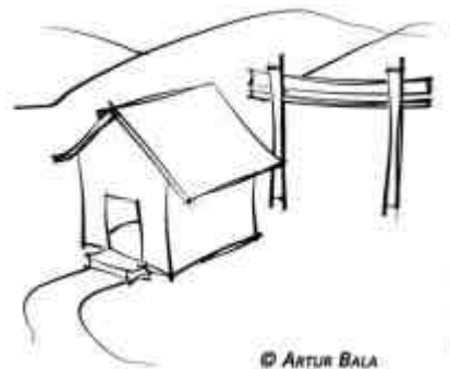
Abbildung: Copyright Artur Bala

Die Möglichkeiten ein Bild aus dem Computer täuschend echt aussehen zu lassen, sind im Laufe der Jahre immer besser geworden. Nun holt CINEMA 4D zum nächsten Schlag aus. NPR heißt das Zauberwort: Non-Photorealistic Renderer. Das bedeutet nichts anderes, als dass nun auch all das möglich ist, was nicht unbedingt realitätsnah oder fotorealistisch aussehen soll. Die Vielzahl der Stile, die sich mit Sketch and Toon erzeugen lassen, ist beinahe grenzenlos.