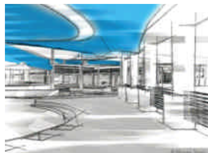
Abbildung: Skizzeneffekt