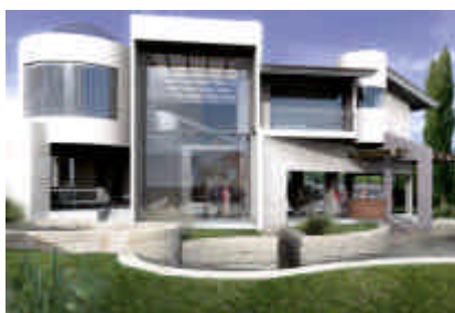
Abbildung: Copyright Infografica Arquitectonica

CINEMA 4D ist ein inzwischen weltweit über 100 Mal ausgezeichnetes Produkt für Visualisierungen aller Art von der MAXON Computer GmbH (ein Unternehmen der Nemetschke Gruppe). Im Zusammenspiel mit Allplan entfaltet sich die volle Leistungsfähigkeit für Architekten. Selbst Gelegenheitsanwender kommen dank des ausgeklügelten einfachen Bedienkonzepts zu hervorragenden Ergebnissen.