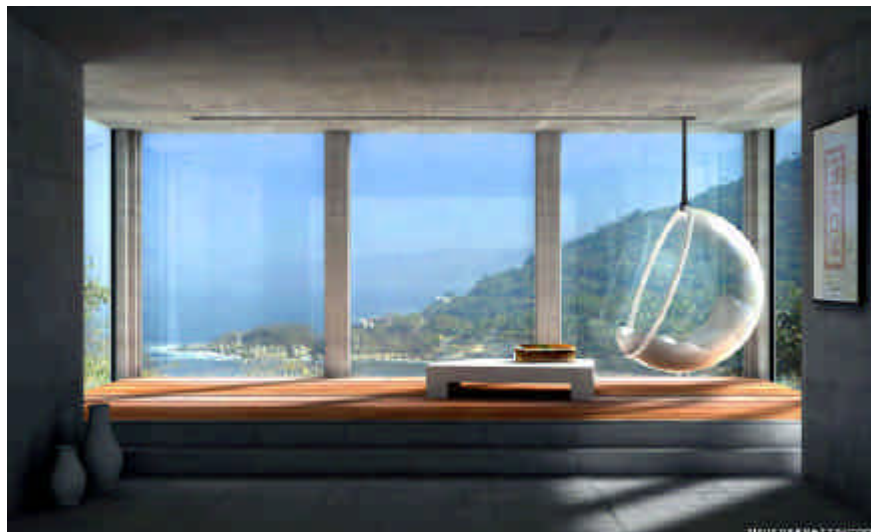
Abbildung: High-End-Rendering mit CINEMA 4D, Copyright Martin Ernst

Eine hochwertige Visualisierung ist heute wichtiger denn je. Sie bringt den entscheidenden Vorsprung bei Wettbewerben, erleichtert die Kommunikation zwischen Planer und Bauherr und unterstützt die Vermarktung. CINEMA 4D bietet Ihnen hierfür sämtliche Möglichkeiten bei einfachster Bedienung.