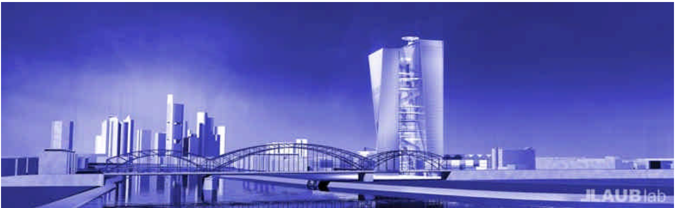
Abbildung: Die Entwürfe zur neuen Europäischen Zentralbank von Coop Himmelb(l)au wurden von der Firma Laublab in CINEMA 4D visualisiert und gewannen den ersten Preis.