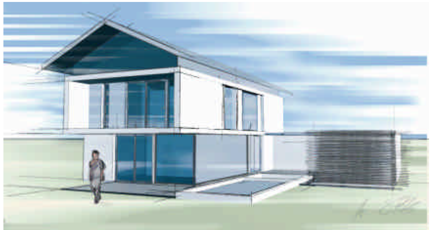
Abbildung: Skizzeneffekt mit CINEMA 4D

Darüber hinaus sind zahlreiche weitere Bibliotheken, wie Texturen, Pflanzen, Autos, Menschen, Straßen und vieles mehr optional erwerbbar. Es werden sogar Bibliotheken anderer Programme von CINEMA 4D unterstützt und können eingesetzt werden. Ein besonderes Highlight ist die neue RPC-Anbindung. Hiermit lassen sich die umfangreichen Real People-Bibliotheken von Archvision nutzen, um in Windeseile eine Szene mit bewegten Menschen oder Autos zu bevölkern.