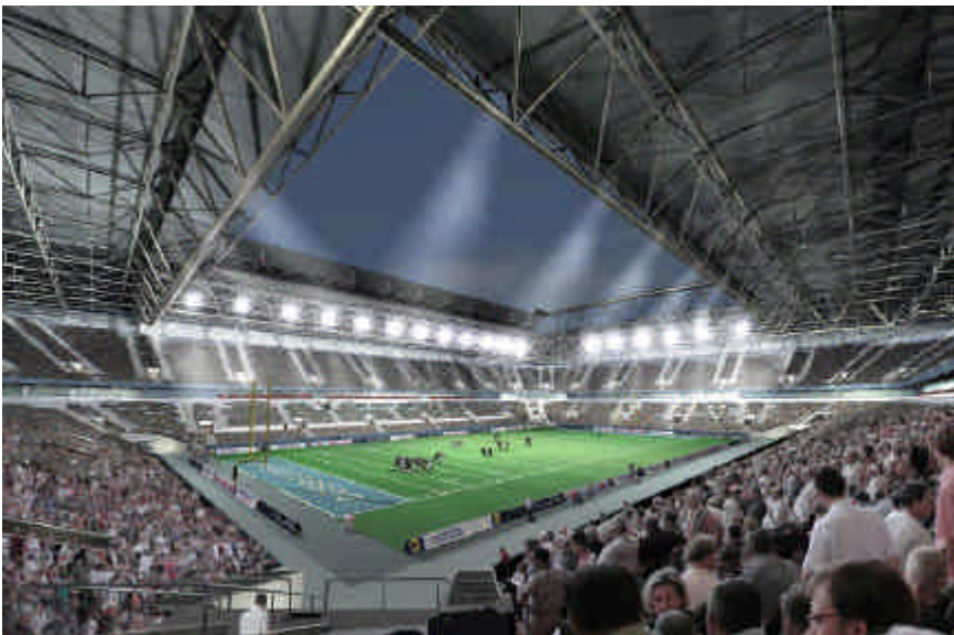
Abbildung: Multifunktionsarena Düsseldorf, visualisiert mit CINEMA 4D von bpg design, Stuttgart

Schalten Sie während einer Animation einfach die Kamera um – schon erhalten Sie die passenden Schnitte, um Ihren Film noch professioneller aussehen zu lassen. Natürlich lassen sich auch alle anderen Objekte, inkl. Beleuchtungseinstellungen animieren. Laufende Menschen und fahrende Autos per Zusatzbibliothek sind mit wenigen Mausklicks hinzugefügt.