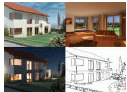
Abbildung: Tag-, Nacht-, Innen- und Comic-Ansicht

CINEMA 4D lässt sich hervorragend zusammen mit Allplan einsetzen. Die für Allplan charakteristischen Datenstrukturen werden 1:1 in CINEMA 4D wieder abgebildet und stehen zur weiteren Bearbeitung zur Verfügung. Es können also alle in CAD erstellten 3D-Daten verlustfrei weiterbearbeitet werden. Der Clou an der Datenübergabe zwischen Allplan und CINEMA 4D ist die komfortable Verbindung der beiden Programme mittels Update-PlugIn. So können beispielsweise Änderungen am