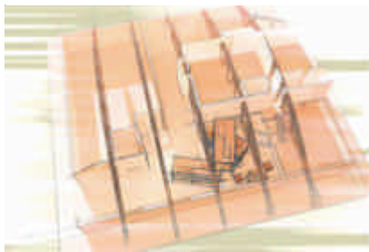
Abbildung: Copyright Michael Stehle Design

Saubere technische Zeichnungen sind damit ebenso möglich, wie der Look einer schnellen Skizze. Eine Filzstift- oder Kohle-Zeichnung genauso, wie abstrakte Malstile. Rasterpunkte oder Comic-Stil, Standbild oder Animation – das alles bleibt allein Ihnen überlassen. Sogar die nahezu beliebige Kombination verschiedener Stile (sogar gezeichnet kombiniert mit fotorealistisch!) ist dank des einzigartig modularen Konzepts von CINEMA 4D nun kein Problem mehr.