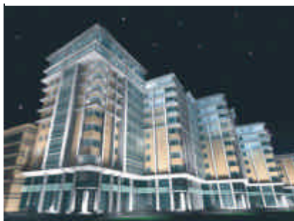
Abbildung: Copyright Studio Art Architects