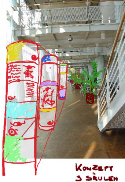
Abbildung: Karsten Winkels, bauwerkstatt

In Verbindung mit den Konstruktions-Modulen bringt Ihnen Allplan Freihand Ihre individuelle Architekturhandschrift auf den technischen CAD-Daten zurück. Sie haben unendlich viele Möglichkeiten Ihre Allplan CAD-Daten mit echten Freihandskizzen zu erweitern. Mit Allplan Freihand können Sie diese entweder als Hintergrund-Dokument verwenden und darüber skizzieren oder direkt auf dem Allplan-Dokument zeichnen. Natürlich haben Sie auch die Möglichkeit, das Hintergrund-Dokument und eine Freihandskizze nachträglich zu vereinen. Zusätzlich können Sie die Allplan-Daten pixelorientiert bearbeiten. Dafür steht Ihnen eine Vielzahl von Werkzeugen zur Verfügung wie z.B. Pixel aktivieren und bearbeiten. Verwenden Sie hierzu einfach den Cutter, den Farbeimer oder den Zauberstab – oder ändern Sie einfach die FSH- und Transparenzwerte. Zusätzlich ermöglichen verschiedene Stifttypen mit einer breiten Palette von Darstellungsvarianten schnelles und effektives Skizzieren von Entwurfsideen und Präsentationszeichnungen.