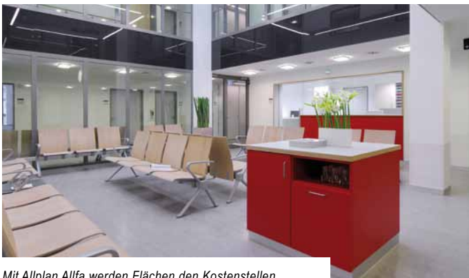
Mit Allplan Alfa werden Flächen den Kostenstellen zugeordnet

Allplan Alfa dient oft als Auskunftssystem in sicherheitsrelevanten Bereichen. Gerade im Finanzsektor oder im öffentlichen Dienst müssen Informationen sensibel behandelt werden. Allplan Alfa stellt Ihnen hier ein flexibles und ausgefeiltes Benutzerkonzept zur Verfügung, mit dem Sie sicherheitsrelevante Bereiche abbilden können. So sind Personaldaten,