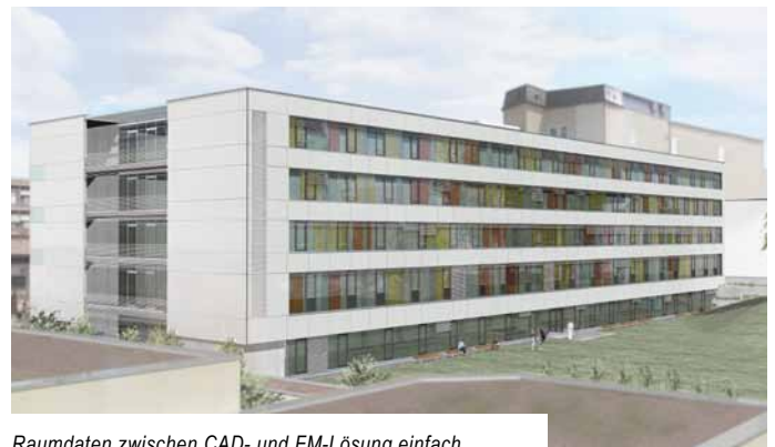
Raumdaten zwischen CAD- und FM-Lösung einfach austauschen