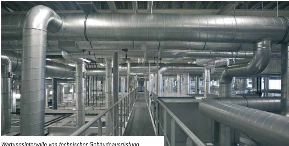
Wartungsintervalle von technischer Gebäudeausrüstung sicher im Griff

Finanzdaten, Produktionszahlen und Verträge jederzeit sicher verfügbar. Datenverschlüsselungen zwischen den einzelnen Komponenten der Datenbank sowie den Webkomponenten sind im Standard von Allplan Alfa integriert.